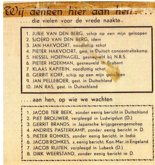
De Oprechte Urker - 29 juni 1945